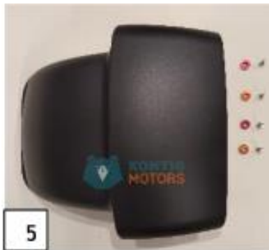
5 Etulokasuoja. (kuva 5).