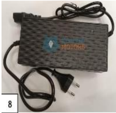
Laturi. (kuva 8).