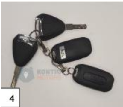
4 Avaimet. (kuva 4).