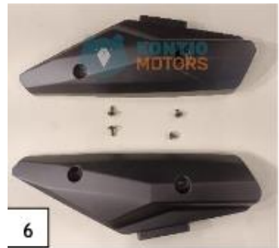
6 Kylkipaneeli. (kuva 6).