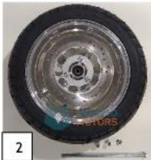
2 Eturengas ja etuakseli. (kuva 2).