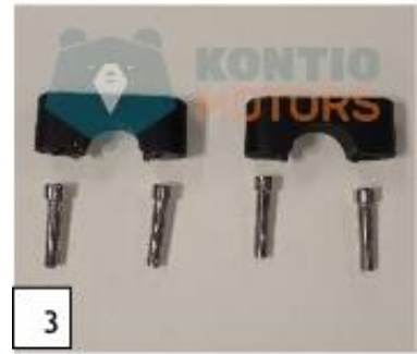
3 Tangon kiinnikkeet ja kiinnikeruuvit. (kuva 3).